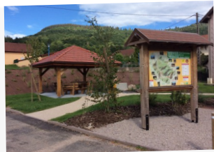
Aire de repos à 50m du départ, entre le Chalet Gourmand et la Montagne Gourmande