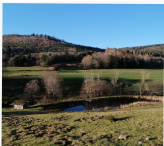
Vallée de Grandrupt